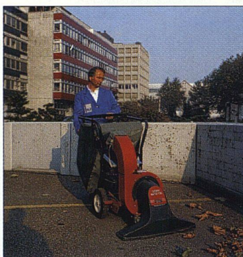
Die Serviceunternehmen sind punktuell und oft mit Maschinen präsent.