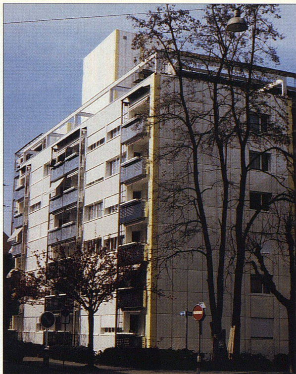
Das Farbkonzept erarbeitete der Zürcher Künstler Gottfried Honegger.

FIRMA IST VERSCHWUNDEN Am 19. Juni 1992 feierte die Baugenossenschaft die gelungene Sanierung. Verschiedene Redner lobten die Renovation, insbesondere auch die vorgehängte Email-Fassade, die der Künstler Gottfried Honegger abschliessend farbig gestaltet hatte. Rundum sah man zufriedene Gesichter.