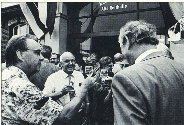
Die SVW-Treffen sind stets ein wichtiger gesellschaftlicher Anlass.