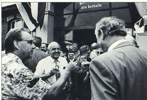
Die SVW-Treffen sind stets ein wichtiger gesellschaftlicher Anlass.