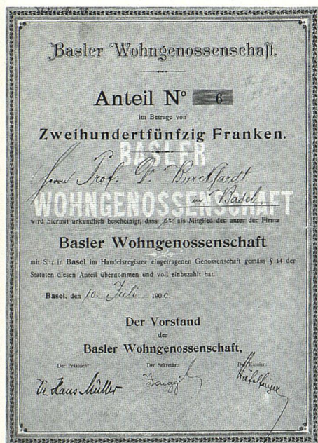
Einer der ersten Anteilscheine der BWG. Die 250 Franken konnten in wöchentlichen Einzahlungen von 50 Rappen beglichen werden.