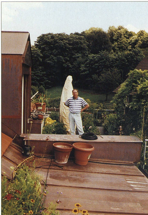
Grosszügige Balkone lassen eine individuelle Bepflanzung zu.