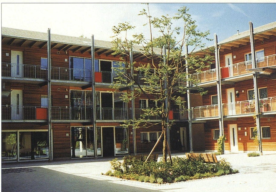
Ein Baum steht im Mittelpunkt des Eingangshofes.

renten durch und bietet einiges fürs Auge: Die dreigeschossige Anlage ist in drei unterschiedlich grosse Baukörper aufgegliedert. Sie ist in U-Form gebaut und öffnet sich dem Quartier gegen Norden hin. Der zentrale Eingangshof mit dem Baum in seiner Mitte ist durch die Orientierung der Laubengänge und des Veloabstellhäuschens garantiert belebt. Der gelbe Anstrich, die schallschluckende Lärchenholzschalung und kleine, rote Elemente in den offenen Aufgängen wirken freundlich. Sehr hell durch ihre Glaswände