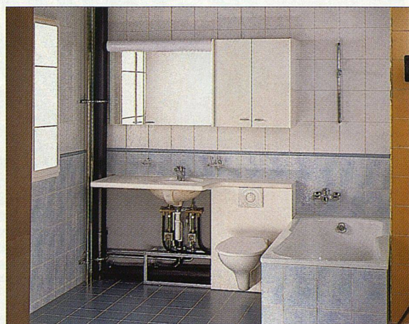
Abb. 3: Badezimmer-Möbel mit integriertem Sanitär-Element