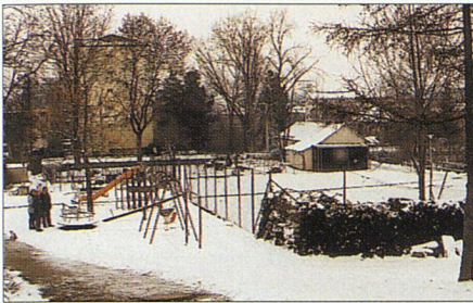
Wohnungsgenossenschaft Sunnige Hof wird bereits eifrig