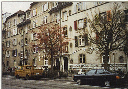
Renovation in ehemals besetzten Häusern in Basel (Bild links): Alfred Kaufmanns Bauteilladen (oben) lieferte Kochherd, Dusche und Durchlauferhitzer in erster Secondhand-Qualität.