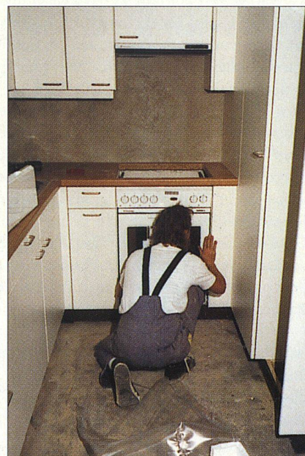
Fortsetzung auf Seite 16