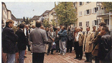
Im Hof der verkehrsberuhigten EBG Altstetten.

Im Rahmen des Weiterbildungsprogrammes der Sektion Zürich SVW fand am 17. Oktober 1995 eine Besichtigung zweier Bauvorhaben statt, welche bei Vertreterinnen und Vertretern der Baugenossenschaften auf reges Interesse gestossen ist. Auf dem Gelände des ehemaligen Bahnhofs Selnau erbaute die Stadt Zürich mit einem überzeugend gelösten Projekt 64 Wohnungen sowie Einrichtungen für die Kinderbetreuung. Eine völlig andere Problemstellung zeigte sich bei der Renovation der Siedlung der Eisenbahner Baugenossenschaft Altstetten. Durch den Anbau von Balkonen und Wintergärten konnte der Wohnwert der Wohnungen wesentlich gesteigert werden.