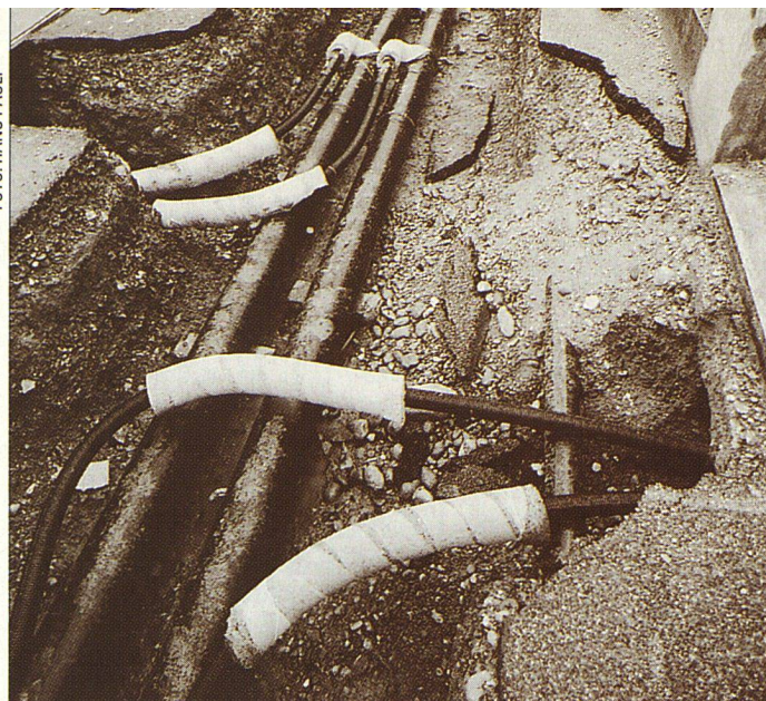
Die Kehrseite der zentralen Wärmeversorgung: Gräben und Wärmeleitungen sind teuer.

fern tatsächlich eine derartige Kombination möglich ist, muss unbedingt die neue Heizanlage auf den Zustand «danach» zugeschnitten werden. Mit neuen Fenstern und mit der Wärmedämmung von Estrichboden und Kellerdecke kann der Wärmeleistungsbedarf einer Siedlung halbiert werden.