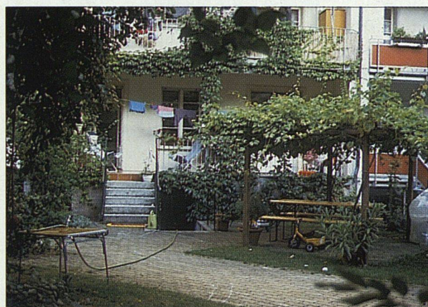
Bewohnbare Aussenräume – dabei geht es um mehr als um eine sozialromantische Forderung zugunsten abgestumpfter Zeitgenossen.