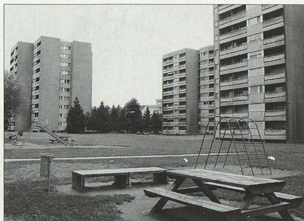
Tscharnergut in Bern: Ausdruck des allgemeinen Desinteresses am Thema «Aussenraum».

TEXT UND BILDER: METRON LANDSCHAFTSPLANUNG AG