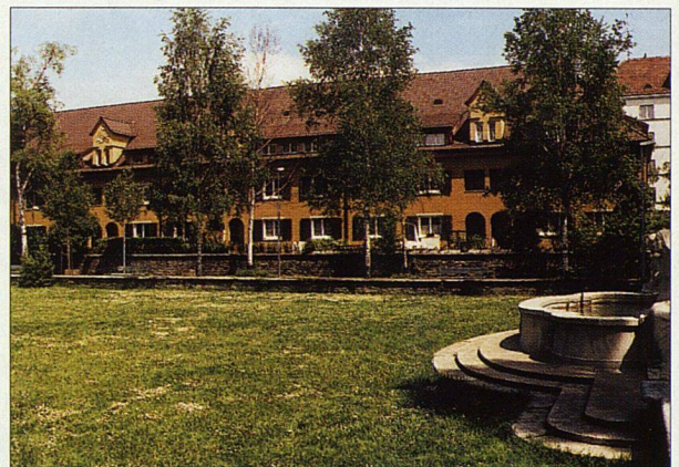
Der Birkenhof, Zürich-Milchbuck: überblickbar und deshalb sicher.

vertreten», stellen zum Beispiel die Herausgeberinnen der Broschüre «Frauen planen, bauen, wohnen» im Zusammenhang mit der IBA Emscher Park schon im Vorwort fest. Der Titel einer englischen Publikation von 1991 bringt den Sachverhalt auf die Kurzformel «Living in a man-made world». Die gebaute Umwelt nimmt zu wenig auf Frauenbedürfnisse Rücksicht, weil sie aus Männersicht entstanden ist. Bauen