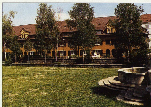
Der Birkenhof, Zürich-Milchbuck: überblickbar und deshalb sicher.

vertreten», stellen zum Beispiel die Herausgeberinnen der Broschüre «Frauen planen, bauen, wohnen» im Zusammenhang mit der IBA Emscher Park schon im Vorwort fest. Der Titel einer englischen Publikation von 1991 bringt den Sachverhalt auf die Kurzformel «Living in a man-made world». Die gebaute Umwelt nimmt zu wenig auf Frauenbedürfnisse Rücksicht, weil sie aus Männersicht entstanden ist. Bauen