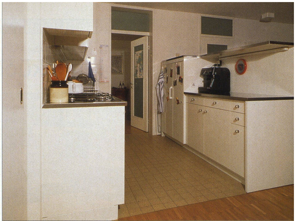
Halb feste Küchenfront, halb bewegliches Möbel – diese Küche ist nicht endgültig festgelegt.

Wohnen: Was ist bei der Küchenplanung grundsätzlich wichtig?