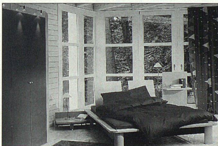
Praktisch: Die Liegefläche steht auf zwei Füüssen und zwei Bettpodesten, die sich seitlich verschieben lassen. Möbel Pfister.

DER TISCH ALS ZENTRUM Die Sitten haben sich geändert. Heute wird wieder am Tisch geredet. Hat man in den letzten Jahrzehnten die Gäste nach dem Essen in die neue Sitzgarnitur gebeten, bleibt die gemütliche Runde heute oft am Tisch. In den internationalen Möbelkollektionen drängen sich die länglichen Tische vor, rezeptionsartiger und ovale, möglichst gross und erweiter- oder ausziehbar.