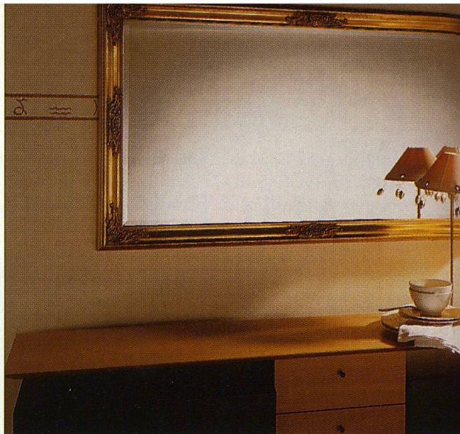
Nostalgie: Der Barock-Spiegel «Amalfi» besitzt einen goldgespritzten Rahmen aus Holz und Kristallglas mit geschliffenen Facetten. Interio.

Möbel, das waren einst Laubhaufen unter irgendeinem Felsüberhang und ein Platz zum Hocken, nahe am Feuer – dem Konzept nach also recht mobil. Inzwischen haben wir gelernt, unser Nest aufzumöbeln. Und jeder hat da seine Bedürfnisse. Die einen wollen sich verkriechen, andere ihren Geschmack beweisen, wieder andere sehnen sich nach Originalität, und natürlich gibt es noch die, die ihr Geld darstellen müssen. Wenn man hart am Trend wohnt, lauert allerdings immer schon der alte Ekel: das Ermatten am überholten Stil. Das kann sehr schnell gehen. Spätestens seit die Billigkaufhäuser sich der schwellenden Sitzgruppen bemächtigt haben, der farbigen Paukenschläge auf den Ausstattungsstoffen, der Naturholzbetten, hält es uns nicht mehr in denselben.