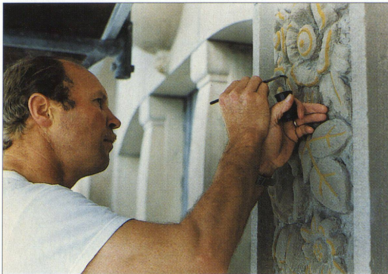
Auflegen des Mixtion auf die gelb unterlegten Konturen und Lichter. Dabei ist besonders genau zu arbeiten, damit das Goldanlegeöl nicht in den porösen Sandstein ausläuft.