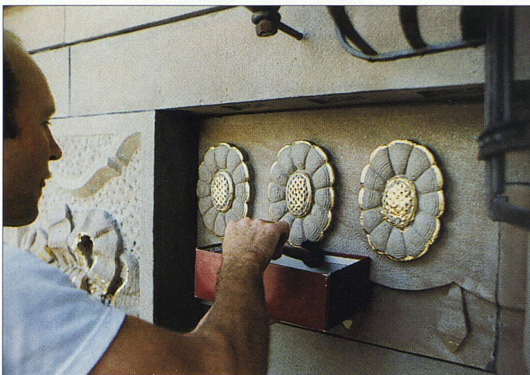
Nach dem Anbringen des Transfergoldes wird es eingekehrt mit einem Pinsel aus Eichhörnchenhaar. Links das auf diese Weise geglättete Gold, rechts die noch unscharfe und massig wirkende Blumenrosette.