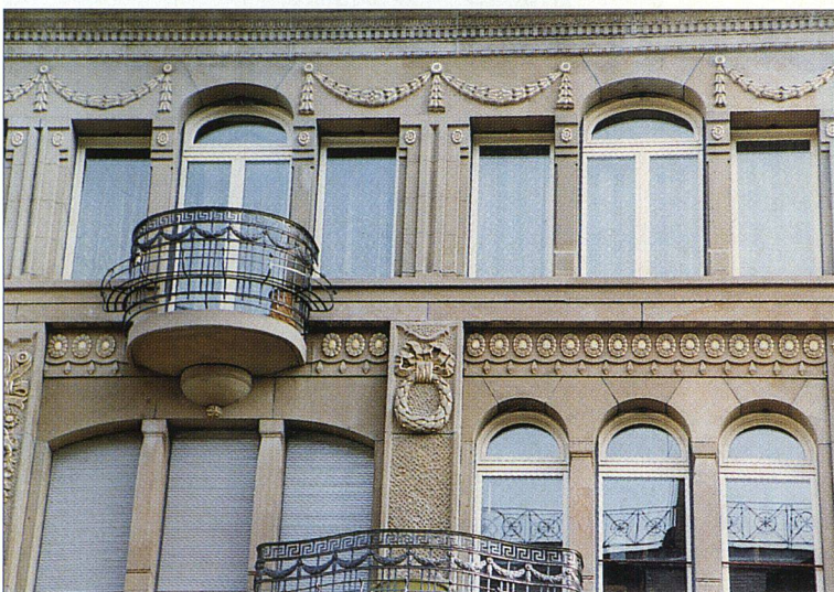
Verschiedene Ornamente nach erfolgter Renovation.

pherie. So verwendete er für die Fassaden unter anderem römische, gotische und Jugendstilelemente. Dies ist typisch für den Historismus, einen Architektur-Typus des ausgehenden 19. Jahrhunderts. Diese Epoche brachte keinen eigenen Baustil hervor, sondern orientierte sich an älteren Vorbildern. Insofern muten Hardmeiers Bauten konservativ an; zwischen 1910 und 1920 bauten andere Architekten zukunftsorientiert. Die Häuser an der Bertastrasse 3, 5 und 11 stehen dennoch als Zeugen einer neuen baulichen und sozialen Gesinnung da, denn ihre prunkvollen Fassaden waren nicht für eine herrschende Bevölkerungsschicht geschaffen worden, sondern für die arbeitende Klasse. Die Gebäude, die sich heute im Besitz der Baugenossenschaft Zentralstrasse befinden, wurden im letzten Jahr renoviert. Die Sanierungsarbeiten umfassten verschiedene Massnahmen, am interessantesten war jedoch die Restaurierung der vergoldeten Sandsteinfassaden.