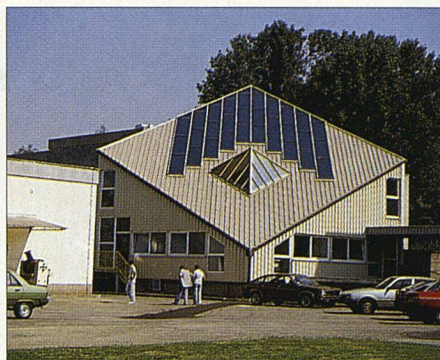
Der Beginn der ökologischen Produktion: Photovoltaikmodule zur solaren Stromerzeugung eines mittleren Unternehmens.

Die Theurillat-Gruppe mit mehreren Firmen aus dem Baugewerbe ist dabei, ihre verschiedenen Umweltbemühungen zu systematisieren. Ihr Umweltleitbild datiert von 1994, die Zielformulierung für die einzelnen Firmen der Holding-