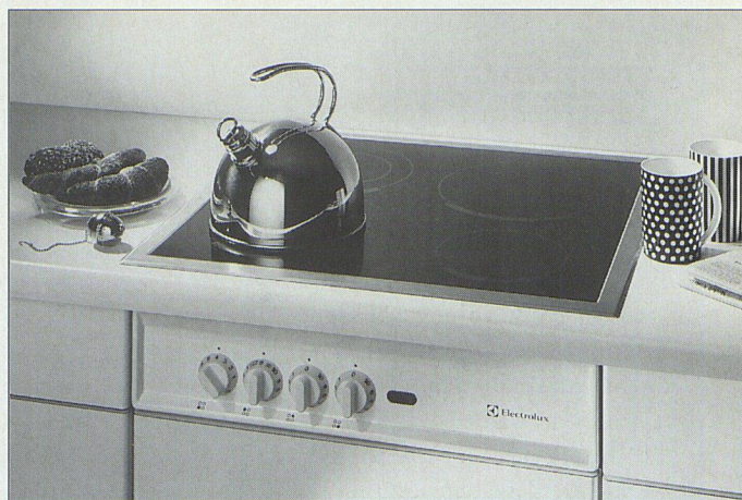
«Sandwich» und Schnappfeder: Diese umweltgerechte Lösung reduziert die Einbauzeit.

Sicher wollten Sie auch schon das eine oder andere Haushaltgerät endlich durch ein neues, besseres ersetzen. Und liessen dann doch vom guten Vorsatz ab, weil Ihnen der Aufwand zu gross und zu kompliziert erschien. Dabei lassen sich die meisten Haushaltgeräte innert 24 Stunden problemlos ersetzen. Dank dem Schweizer Masssystem (SMS) kann zum Beispiel ein neuer Backofen oder Geschirrspüler ohne Nischenänderung an die gleiche Stelle des alten Gerätes eingebaut werden. Für Küchenmöbel, welche ausserhalb dieser Norm gebaut wurden, stehen ausgebildete Einbauspezialisten zur Verfügung, die entsprechende Anpassungen für Normgeräte vornehmen können. Chromstahlmulden mit Gusskochplatten können ohne weiteres durch ein neues Glaskeramikfeld ersetzt werden. In diesem Bereich bietet Electrolux eine Weltneuheit