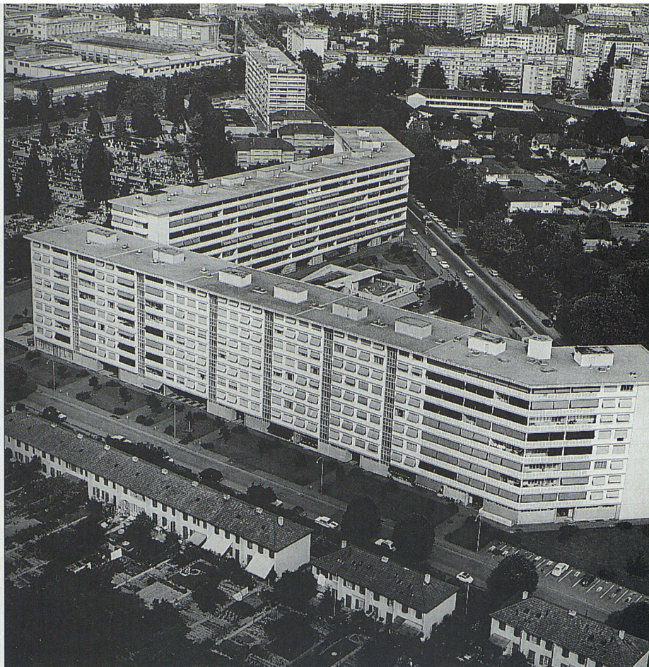
Nouvel Aire (1961), nicht zu vergleichen mit der Cité-jardin d'Aire, die an dieser Stelle 1920–1925 erbaut worden war (s. S.16).