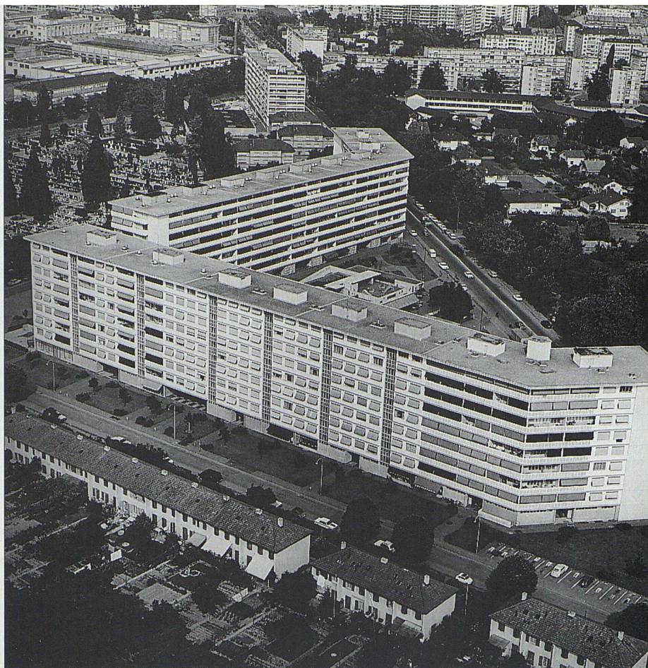
Nouvel Aïre (1961), nicht zu vergleichen mit der Cité-jardin d'Aïre, die an dieser Stelle 1920–1925 erbaut worden war (s. S.16).