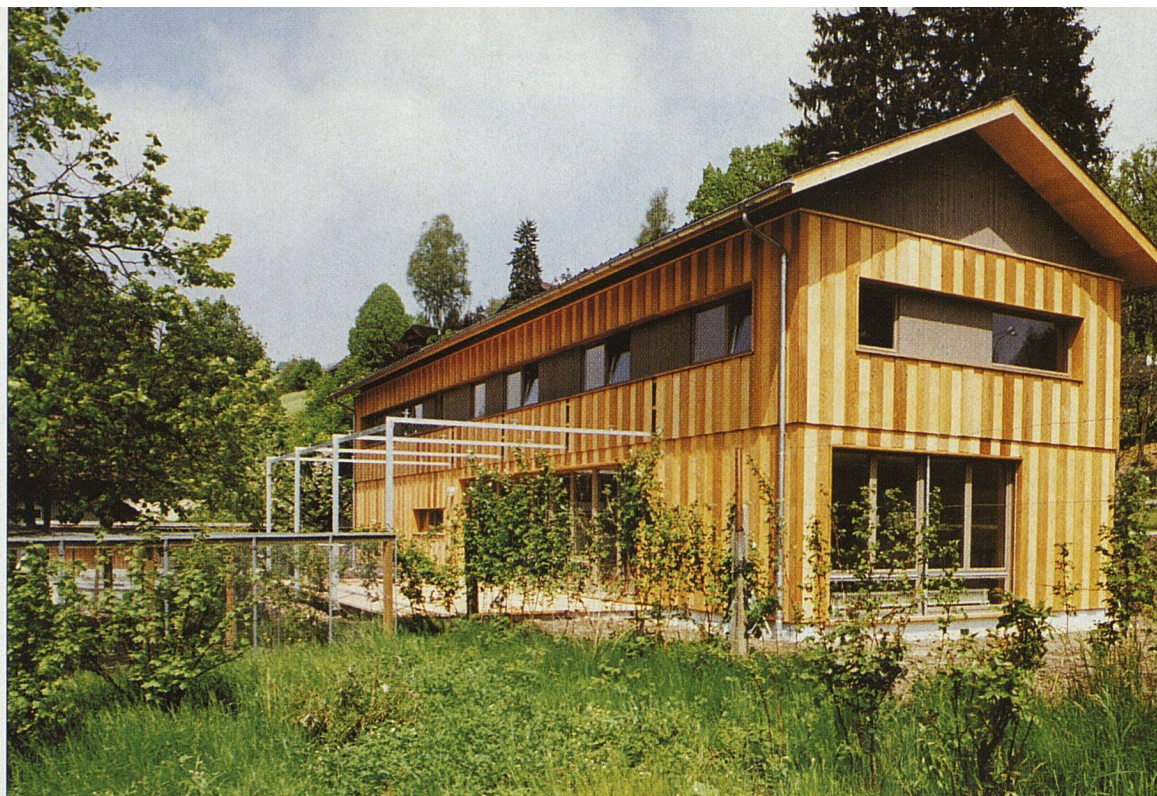
Preisgünstig und rasch realisiert: Wohnhaus Röthlisberger in Langnau (1994)