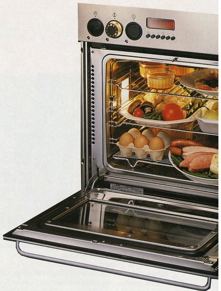
Ein ganzes Menü auf einmal zubereitet spart Energie und Pfannenwaschen.

Fleisch, im drucklosen Dampf gegart, bleibt immer zart, saftig und aromatisch. Es kann weder anbrennen noch austrocknen und weist einen bis zu 15 Prozent geringeren Gewichtsverlust auf. Ein Braten muss nicht laufend übergossen werden; es bildet sich eine natürliche Sauce aus Fleischsaft.