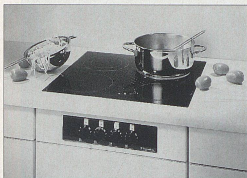
Geringer Energieverbrauch und schönes Design zeichnen die neuen Electrolux Glaskeramik-kochfelder aus.