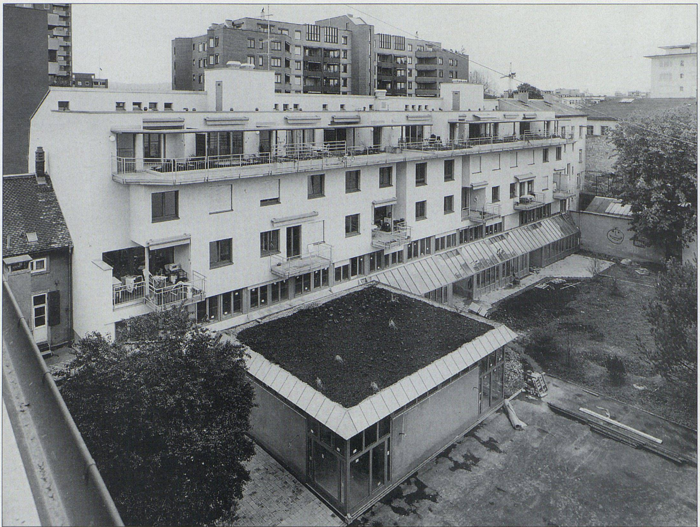
Überbauung Claragraben in Basel

insgesamt 30 Wohneinheiten in Gruppen zu in der Regel 3 Einfamilienhäusern erstellt. Auch hier wurde dem Gemeinschaftsgedanken breiter Raum gewidmet. Eine Wohn- und Spielstrasse im Eigentum der Verwaltungsgenossenschaft, eine Gemeinschaftsparzelle mit Kinderspielplatz sowie Ateliers, in denen ein Gemeinschaftsraum für die Siedlung eifrig benutzt wird, belegen dies. Auch in Rothenburg wurde eine Wohnstadt-Verwaltungsgenossenschaft gegründet, welche sich aus den Eigentümern der Einfamilienhäuser zusammensetzt.