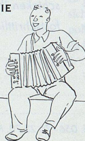
Zum Genos- senschaftstag