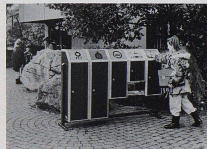
MULTI-MÜLLEX, das durchdachte System für Abfalltrennung in Schulen, Sportanlagen, öffentlichen Räumen und so weiter. Hersteller: Stöckli AG, 8754 Netstal ■

Die konsequente Abfalltrennung im Haushalt scheitert oft am mangelnden Platz. Das erkannte die Fa. Stöckli in Netstal schon früh und entwickelte das umfassende Programm von MÜLLEX Kehrrichtautomaten. Diese wahren Raumwunder passen in jede Einbauküche und umfassen bis zu fünf Behälter – z.B. für Kehrrecht, Kompost, Blech, Alu und Batterien. Sie sind die Garantie dafür, dass die ganze Familie bei der Abfalltrennung mitmacht.