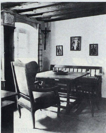
Wohnzimmer in der Fuggerei

Die erste Sozialsiedlung der Welt sollte ein angesehenes und gepflegtes Stadtquartier der schuldlos Verarmten sein. Es besitzt eigene Mauern und Tore, die heute noch von abends zehn Uhr bis morgens um sechs Uhr verschlossen sind,