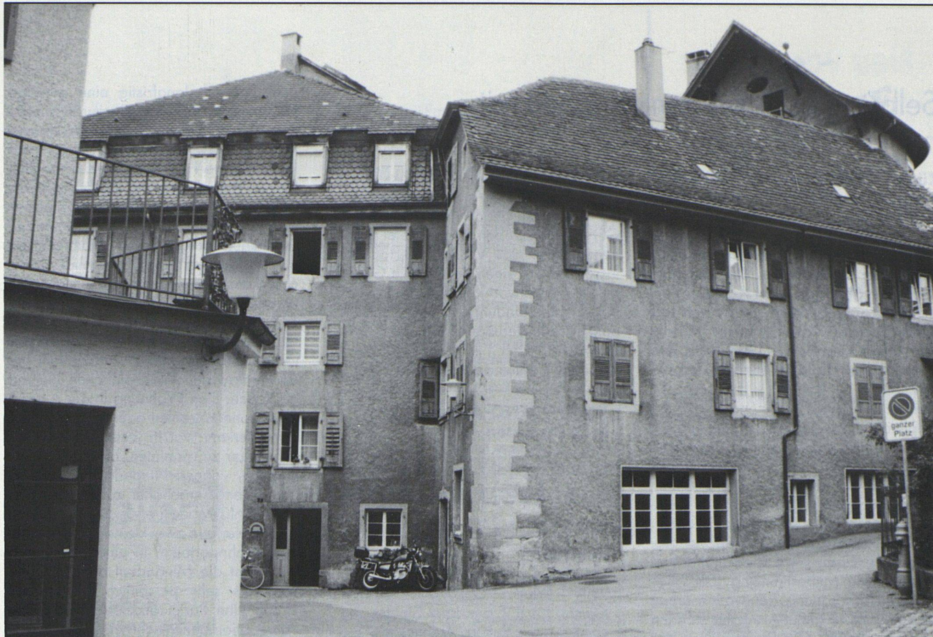
Alte Bausubstanz erhalten und günstigen Wohnraum bieten: An der Wassergasse 8 in Rheinfelden vermietet die 1983 gegründete WOGENO Aargau 13 Wohnungen, 1 Atelier und 2 Gewerberäume.

tigkeitsgefühl steigen indessen auch die Ansprüche. Ohne Aussicht auf eine andere Wohnung werden allfällige Mängel einer Wohnung wieder als schwerwiegend empfunden. Wenn der Traum vom eigenen Haus verblasst, zieht man den Spatz in der Hand vor: die Genossenschaftswohnung. Doch gerade bei Mietwohnungen, also auch bei Genossenschaftswohnungen, liegt eine besonders ausgefallene Gestaltung nicht drin. Unsere Häuser sind mit einem sehr grossen Anteil an Hypothekendarlehen belastet, so dass die Zinserhöhung auch eine enorme Steigerung der Mietzinse gebracht hat, ohne dass Sanierungen oder Verbesserungen vorgenommen wurden. Die Belastung ist so hoch, dass eine umfangreiche Sanierung ohne WEG kaum denkbar ist.