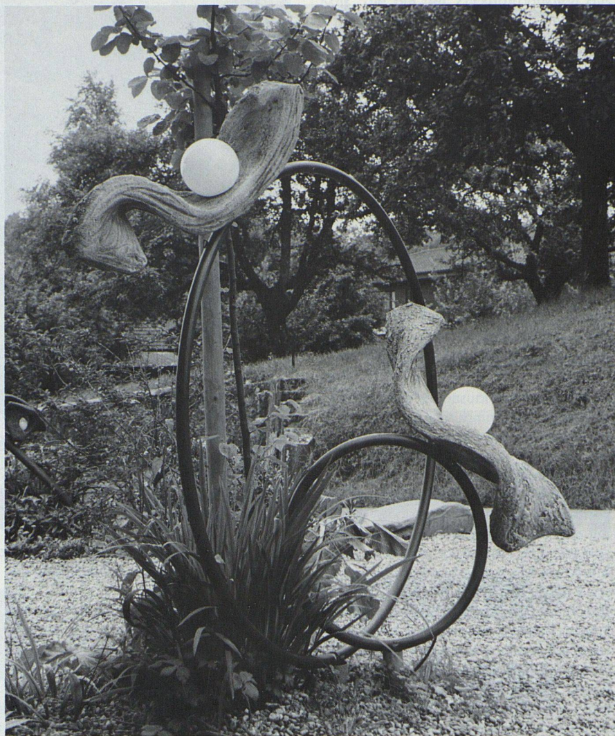
«Licht und Schatten begleiten uns in allen Bereichen.»

«Aus dem Bauch heraus» will sie arbeiten, Intuition ist ihr das Wichtigste. Das gilt besonders für ihre aussergewöhnlichen Lichtobjekte, die an verschiedenen Orten im Freien aufgestellt werden. Diese Kunstwerke lassen sich am treffendsten mit einem Wort von Paul Klee beschreiben: «Wir konstruieren und konstruieren, und doch ist die Intuition immer noch eine gute Sache.»