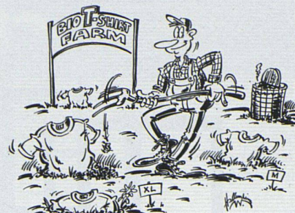
Bilder aus WWF Infoblatt Nr. 20

...oder ein T-Shirt von der Bio-Farm – aber Naturfasertextilien sind beständiger als andere Kleider und naturgerecht hergestellt.