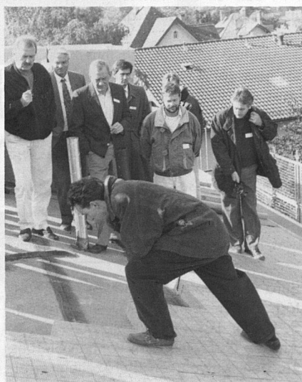
Demonstration der neuen, vollflächigen Verlegungsart von Dämmplatten am Steildach.

Dieser Anordnung entspricht das «Flumserdach» in idealer Weise. Dank der neuen Dämmtechnik ist es nun erstmals möglich, Mineralwoll-Dämmplatten auf Steildächern vollflächig zu verlegen. Der Dachdecker kann die trittfesten Flumroc-Dämmplatten direkt aneinanderreihen und mit der Konterlattung verschrauben. Der Einsatz von Hilfshölzern erübrigt sich. Eine neuentwickelte Schraube mit Doppelgewinde sichert die statische Verbindung zwischen der tragenden Kon-