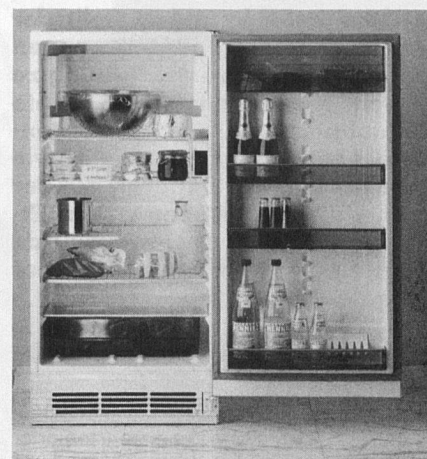
Energiesparender Kühlschrank von Electrolux. Modell RF 938 Cooler, 252 Liter Nutzinhalt = 0,7 kWh pro 24 Stunden oder 0,27 kWh pro 100 Liter.

Der Massnahmenkatalog für die Energieeinsparungen im Produktionsprozess enthält einige Dutzend Vorschläge. Nebst kurzfristig realisierbaren Anpassungen im Produktionsablauf waren auch einschneidende Veränderungen unabdingbar. Die Erstellung einer Energiebilanz machte die Ergebnisse für alle sichtbar. Dadurch wurden Mitarbeiterinnen und Mitarbeiter sensibilisiert und zugleich motiviert. Ein internes Schulungsprogramm zum Energiesparen in allen Bereichen ist bereits realisiert. Die Fabrikationshallen wurden nach den neusten Erkenntnissen wirkungsvoll isoliert. 1983 konnte der neue Elektro-Emailierbrennofen mit einem besseren Wirkungsgrad in Betrieb gesetzt werden. Die Wärmerückgewinnung für die Gebäudeheizung und die zentrale Warmwasseraufbereitung sind vollumfänglich realisiert. Die griffigen Energiesparmassnahmen hatten Erfolg. 1978 wurden pro produzierten Apparat 245 kWh Öl und 167 kWh Elektrizität verbraucht. Bis heute, 1990, konnte der Energieverbrauch pro Produktionseinheit beim Öl auf 40 kWh und bei der Elektrizität auf 35 kWh gesenkt werden. Trotz gleichzeitiger markanter Steigerung der Jahresproduktion von 28 000 auf 115 000 Geräteeinheiten konnte der Gesamtverbrauch in der gleichen Zeitperiode um rund 28 Prozent gesenkt werden. Mit der effektiv eingesparten Energie könnten während 12 Jahren jährlich rund 100 4-Personen-Haushalte mit Elektrizität und Öl versorgt werden. Hätte das Werk Schwanden keine Energiespar- und Rationalisierungsmassnahmen vorgenommen und würde