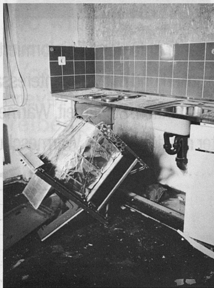
Zuerst werden die Apparate ausgebaut.

Die Küche ist ein Teil des sogenannten Nassbereiches einer Wohnung: sie hängt an einem komplexen System von Zu- und Ableitungen der Wasserversorgung und Abwasserentsorgung. Sie ist auch mit dem elektrischen Leitungsnetz verbunden und mit einem Be- und Entlüftungssystem. Zieht man also einen Küchenumbau vorerst aus rein optischen Gründen in Betracht, weil die Fronten beschädigt oder veraltet sind, oder aus technischen Gründen, weil die Apparate den Anforderungen nicht mehr genügen,