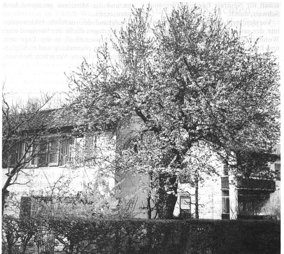
Wohngenossenschaft 1943 Jakobsberg Basel

Die Dachorganisation BNW der Bau- und Wohngenossenschaften in der Region Basel war in den vergangenen Jahren überaus aktiv. Ihr jüngster Jahresbericht hält fest, dass im Bund Nordwestschweizerischer Wohngenossenschaften Ende 1986 122 Bau- und Wohngenos-