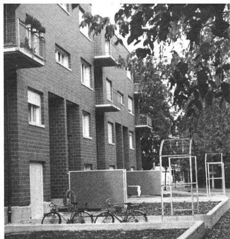
Bild links: Bereits vor der endgültigen Bepflanzung vermittelt diese Ansicht das Bestreben nach parkähnlicher Umgebung.