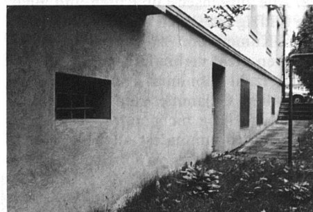
25 Jahre nach Mauerentfeuchtung

die zwei Vergleichsfotos, wie sich eine Fassadenentfeuchtung über 25 Jahre tadellos bewährt hat. Genaue Objektangabe und technische Unterlagen werden gerne zugestellt.