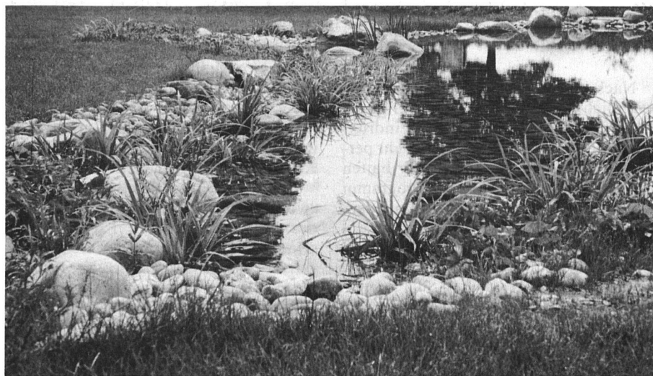
Feuchtbiotop mit Bach

Eine natürliche Pflanzengemeinschaft, künstlich in eine technisch erschlossene und damit meist umweltfeindliche Umgebung gebaut, braucht