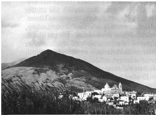
Der Ätna auf Sizilien und der unweit davon auf einer Nachbarinsel tätige Vulkan Stromboli zeugen beide täglich davon, dass auch das Erdinnere in dieser Gegend noch lange nicht zur Ruhe kommt. Auf unserem Bild der Stromboli.

Auf einer Insel, auf der Griechen, Römer, Normannen, Araber, Spanier und noch einige Völkerstämme jahrhundertlang gelebt und gewirkt haben, erscheint das logisch.