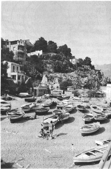
Kleiner Fischerhafen unweit des Touristenparadieses Taormina.