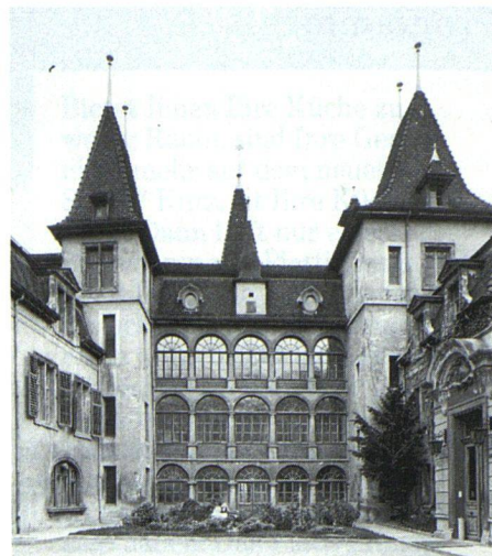
Sierre/Siders, der Kongressort 1983 des Schweizerischen Verbandes für Wohnungswesen, wird für viele Delegierte zweifellos mehr als nur reizvoller Rahmen eines Jahreskongresses sein.