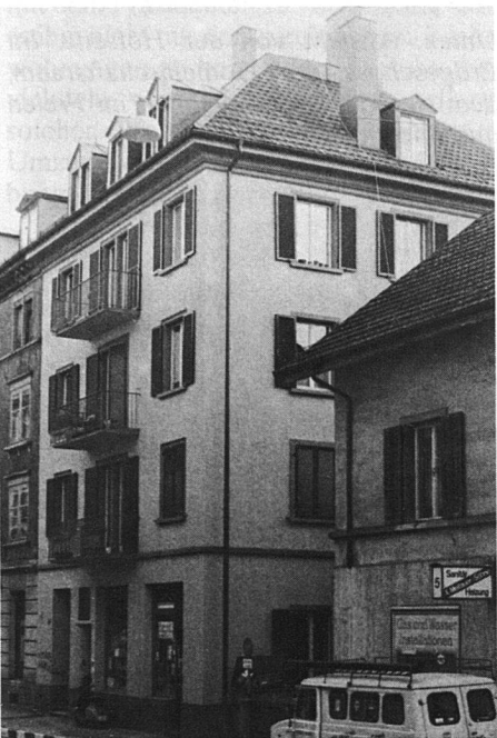
Köchlistrasse 3, 8004 Zürich. Solidarität unter Genossenschaftern: Nach der Renovation wurden keine kostendeckenden Mietzinse verlangt (Beispiel 1).