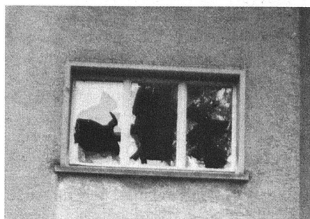
Unsere Bilder zeugen vom langen Kampf gegen Hausbesetzer und Vandalen

Die leerstehenden Häuser wurden zum Objekt jener Kreise, die so gerne ihre «Besetzungsspielchen» durchführen. So wurde vor allem der 1. Mai dieses Jahres für eine entsprechende Aktion durch Flugblätter angekündigt. Tatsächlich versuchten der Polizei bekannte Aktivisten der Krawallszene von 1968 in die Häuser einzudringen, was die Polizei jedoch verhindern konnte. Wer nun jedoch glaubt, rund um diese Häuser sei es