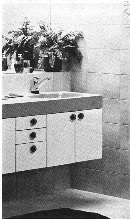
Oben: Moderner Waschtisch von heute