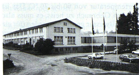
Das Fabrikgebäude der Berg-Küchen AG im thurgauischen Berg. Hier sorgen 55 qualifizierte Mitarbeiter für die Herstellung hochwertiger und qualitativ hervorragender Schweizer Küchen.

Eine kürzlich durchgeführte Marktanalyse ergab, dass die Berg-Küchen in der Öffentlichkeit relativ wenig bekannt sind. Mit der Eröffnung eines Showrooms in Zürich soll in Zukunft diesem Missstand begegnet werden. Die geschmackvoll gestaltete und instruktive Ausstellung an der Beckenhofstrasse 6 in Zürich wurde kürzlich eröffnet. B -