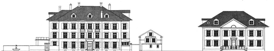
Villetten: Die Villen Laupenstrasse 45 und 49

heisst: keine perfektionistische Renovation mit Veränderung der Struktur der Gebäude. Deshalb wird der dafür verlangte Kredit bewusst auf 3,5 Mio Franken begrenzt.