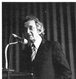
G. Ayer, Freiburg

In wohn- und baugenossenschaftli- chen Kreisen hat die Frage der Schaf- fung von Wohneigentum nie überschäu- mende Begeisterung ausgelöst. Heute je- doch muss man sich offen die Frage stel- len, ob nicht die Genossenschaftsbeweg- ung selbst auf dem Gebiete der Förde- rung des Wohneigentums aktiver wer-