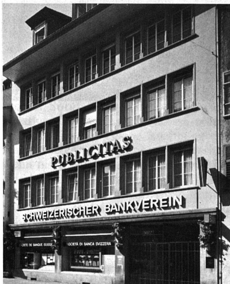
Altstadthaus in Winterthur Holz/Metallfenster, Sprossen aufgesetzt, Isolierglas durchgehend, Metallteile weiss einbrennlackiert.

Neben den mehr formalen Ansprüchen sollen die so konzipierten Fenster selbstverständlich auch hinsichtlich Luftdurchlässigkeit, Schlagregensicherheit und Schallsolation keine Wünsche offen lassen. Bis vor wenigen Jahren bestand keine Möglichkeit, die Erfüllung bauphysikalischer Bedingungen von Fenstern zu überprüfen. Dank den durch die Schweizerische Zentralstelle für Fenster und Fassadenbau (SZFF) in Arbeitsgemeinschaft mit der Eidgenössischen Materialprüfungsanstalt (EMPA) aufgestellten Normen, ist man heute in der Lage, objektive Tests durchzuführen.