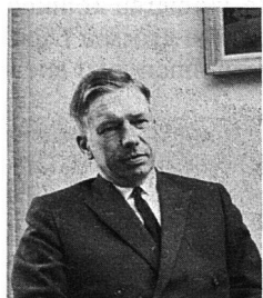
a. Staatsrat F. Picot

Wir leben in einem Zeitalter, wo die Mitbestimmung auf verschiedenen Ebenen – sowohl im Betrieb, im Quartier als auch in der Wohnform – zur Tagesordnung gehört. Einige Kritiker unserer Demokratie behaupten, sie sei eher Formsache als Wirklichkeit. Vor einigen Jahren hatte der Schweizer Juristenverein das Thema «Politische und wirtschaftliche Freiheit» auf der Tagesordnung eines seiner Kongresse.