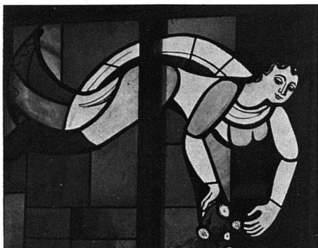
Glasmalerei von Otto Steiger in der Eingangshalle eines Wohnhauses. (Wohngenossenschaft Entenweid, Basel)