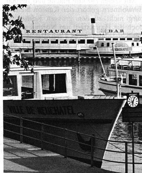
Neuchâtel. Am Quai.

Sibirien», oder nach Les Verrières, wo der französische General Bourbaki im Februar 1871 mit einem Teil seiner Armee auf schweizerisches Gebiet übertrat und sich internieren liess.