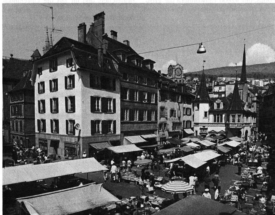
Neuchâtel. Der Markt.