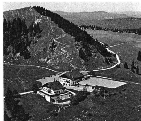
Tête-de-Ran, Jura neuchâtelois

Der Kanton Neuenburg weist gewisse Gegensätze auf. Nicht nur geographisch, auch in anderen Belangen spricht man vom «Unterland» und dem «Oberland». Im letzteren ist die Uhrenindustrie daheim. Nicht von ungefähr geht die Fahrt der Delegierten am Sonntag über den Sattel «Vue des Alpes» (1288 m ü. M.) mitten ins rauhe Hochland mit seinen Bergweiden, Tannenwäldern und Industrieorten, allen voran La Chaux-de-Fonds, mit 42 000 Einwohnern die grös-