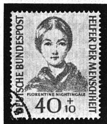
Florence Nightingale 1820-1910

Florence wurde als zweites Mädchen in eine englische Aristokratenfamilie hineingeboren. Das hiess nach damaliger Sitte, dass ihre Erziehung, Ausbildung und «gesellschaftsfähige» Verheiratung in sturen Formen abzuwickeln seien. Das Ziel war, dass eine solche Tochter heiraten, wieder Kinder haben und diese wieder erziehen solle für ein gleiches viktorianisches Schablonenleben in der besseren englischen Gesellschaft.