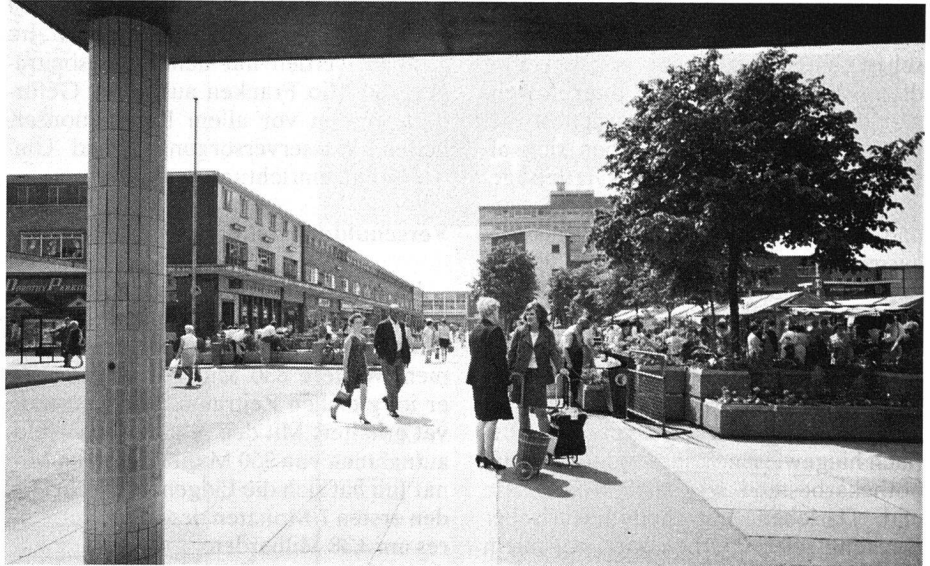
Der reizvolle verkehrsfreie Marktplatz der neuen Stadt Harlow. Ausschlaggebender Aspekt bei der Planung war die Sicherheit und Bequemlichkeit der Bewohner der Stadt. (BFF)

Für sehr viele Familien bedeutete der Umzug in eine neue Stadt, dass sie nun zum erstenmal in ihrem Leben ein Einfamilienhaus mit Garten bewohnen können. Doch in allen neuen Städten werden Wohneinheiten jeder denkbaren Art geboten, um den Anforderungen grosser wie auch kleiner Familien zu genügen und Vertreter aller Einkommensklassen und Geschmacksrichtungen zufriedenzustellen. Ebenso wird natürlich für Alleinstehende und ältere Bürger gesorgt.